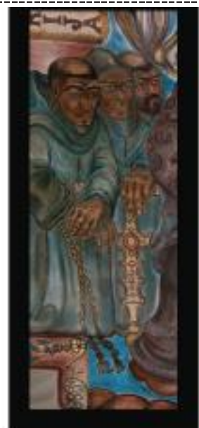
Franciscans Come to New Mexico