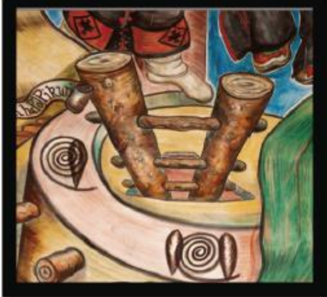
Ladders Used to Enter Pueblo Structure