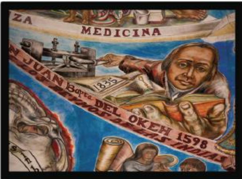
Padre Antonio José Martínez