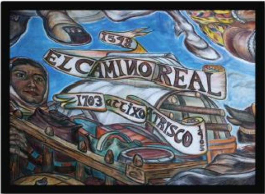
1703 Atrisco Land Grant