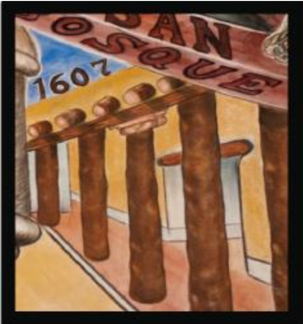
Palace of the Governors