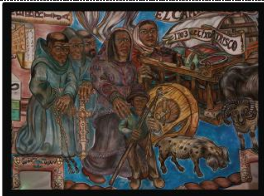
El Camino Real