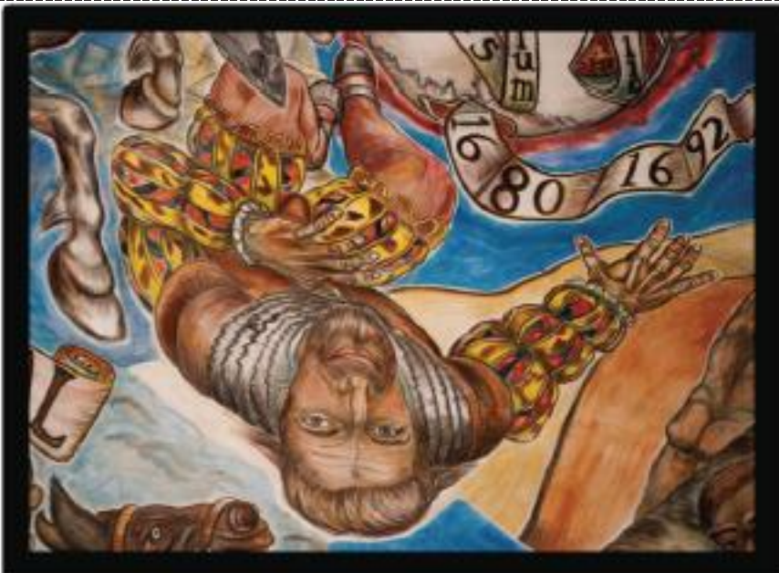
Expulsion of the Spanish Pueblo Revolt