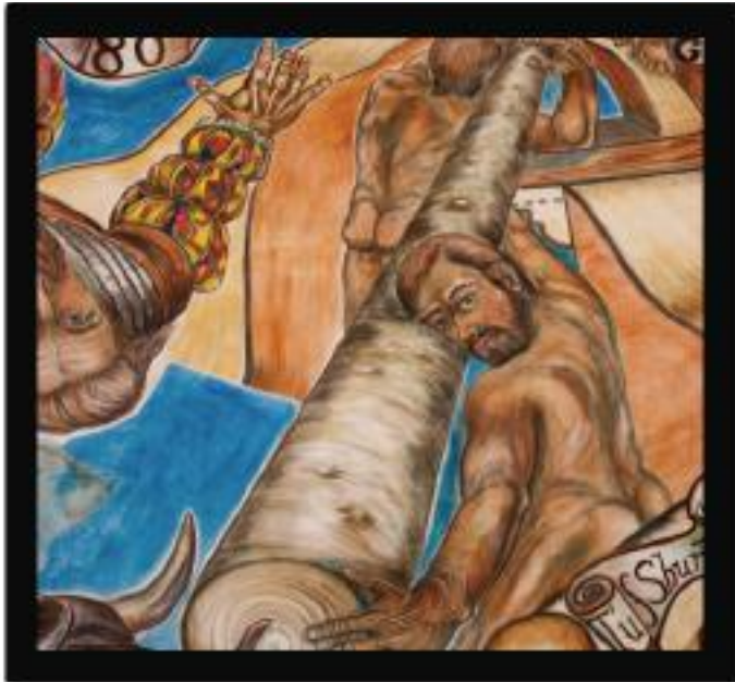
The First Permanent Settlement: Missoin San Gabriel