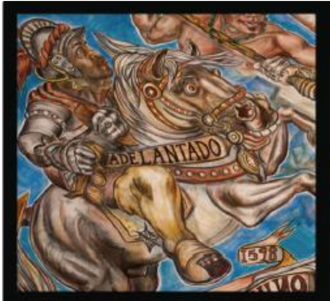
Conquistadores 1598- Juan de Oñate