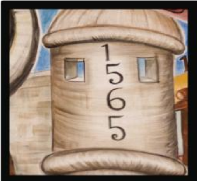
1565 Beginning of Spanish Colonial Period